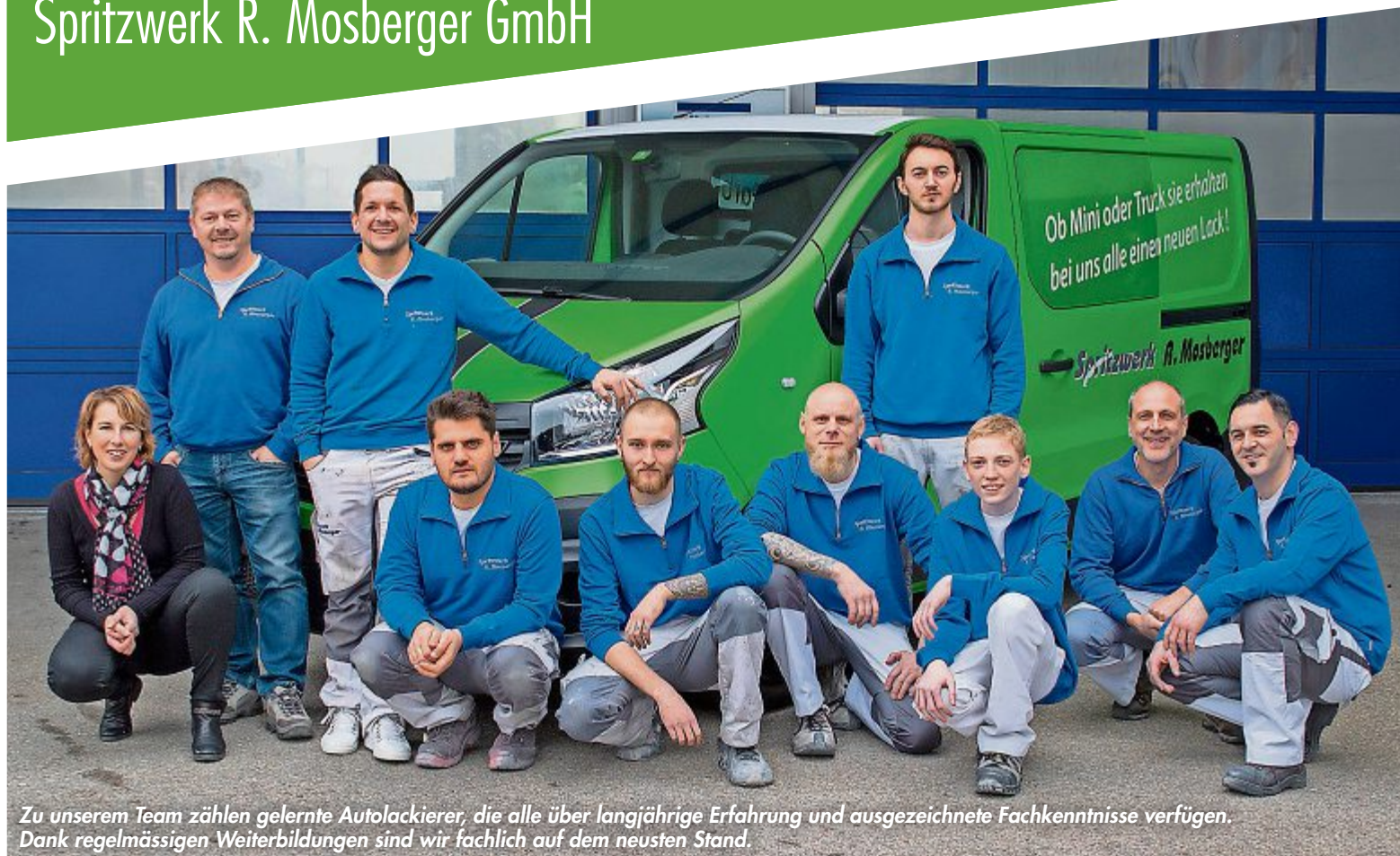
Zu unserem Team zählen gelernte Autolackierer, die alle über langjährige Erfahrung und ausgezeichnete Fachkenntnisse verfügen. Dank regelmässigen Weiterbildungen sind wir fachlich auf dem neuesten Stand.